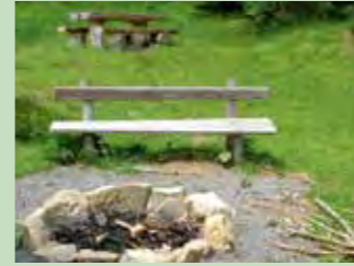
45 Heikentobel, Oberiberg Koordinaten 700 658 / 211 666