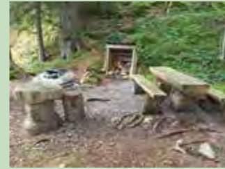
54 Seeblisee, Hoch-Ybrig Koordinaten 702 571 / 207 875