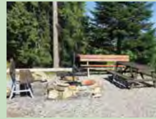
63 Biberegg, Rothenthurm Koordinaten 693 847 / 216 150