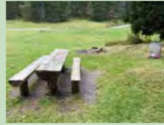
52 Bei der Fuederegg Hoch-Ybrig Koordinaten 701 706 / 207 741