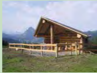
16 Amselgschwänd Koordinaten 698 707 / 215 619