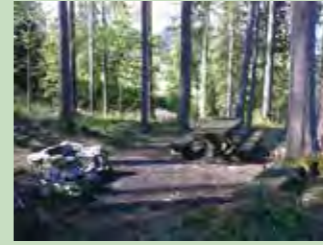
41 Kurwädli, Oberiberg Koordinaten 702 093 / 210 271