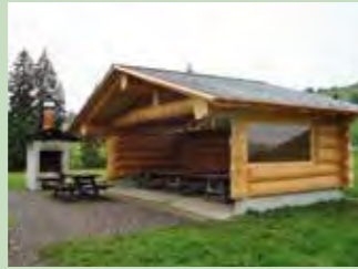
14 Geissgütsch, Gross Koordinaten 700 752 / 218 900