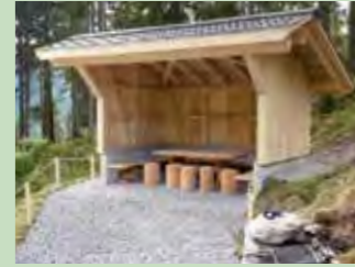
47 Ober Grueb, Chäseren, Oberiberg Koordinaten 704 960 / 208 626