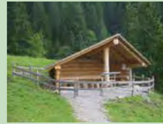
70 Bogenfang, Alpthal Koordinaten 2695 532 / 1212 839