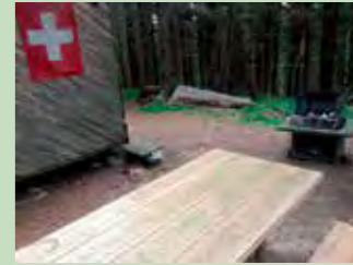
62 Schoshöchi, Rothenthurm Koordinaten 692 680 / 217 618