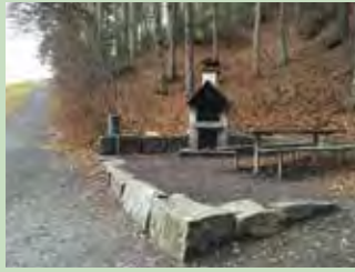
09 Klosterweiher, Einsiedeln Koordinaten 700 172 / 219 968