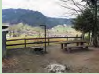
08 Breitweg, Einsiedeln Koordinaten 699 441 / 219 719