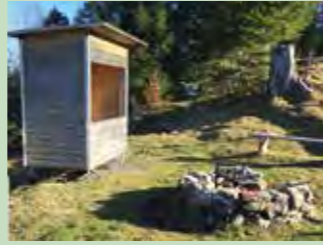
04 Vogelherd bei Stöcklichrüz Koordinaten 704 704 / 223 674