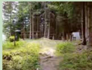
32 Bohnenplätz, Unteriberg Koordinaten 703 095 / 213 282