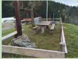
10 Friherrenberg Koordinaten 700 255 / 219 581