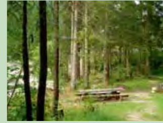
43 Vita-Parcour, Oberiberg Koordinaten 701 133 / 209 858