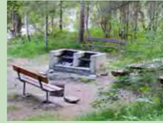
42 Vita-Parcour, Oberiberg Koordinaten 700 873 / 209 718