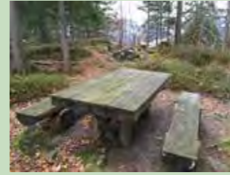
40 Guggern, Oberiberg Koordinaten 703 229 / 212 009