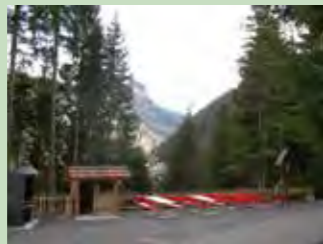
31 Fuchseggä, Unteriberg Koordinaten 703 285 / 213 262