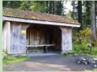
15 Ijenschatten, Gross Koordinaten 700 056 / 216 988