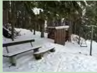
11 Gschwänd, Gross Koordinaten 700 127 / 219 389