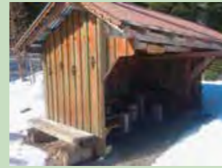
64 Miesboden, Rothenthurm Koordinaten 693 990 / 214 176