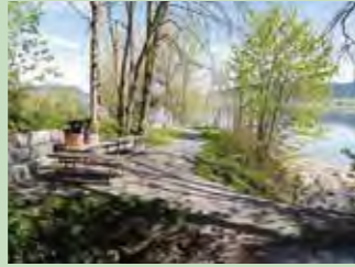
06 Strandweg, Birchli Koordinaten 700 980 / 220 770