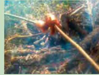
46 Oberwandli, Oberiberg Koordinaten 700 200 / 208 169