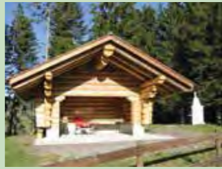
18 Chalberstock, Euthal Koordinaten 706 088 / 217 235