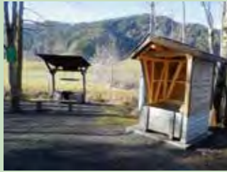
13 Au, Trachslau Koordinaten 698 356 / 219 024