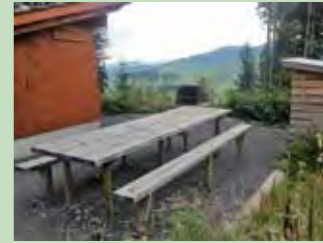
61 Gärtenboden, Rothenthurm Koordinaten 693 003 / 218 707