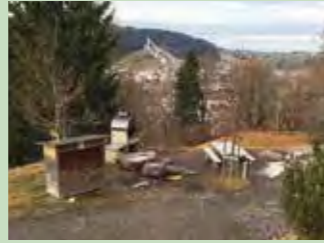
07 Wasserhüsi, Einsiedeln Koordinaten 699 496 / 219 982