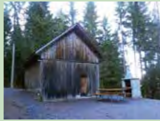
20 Wythenboden, Bolzberg Koordinaten 696 746 / 219 699