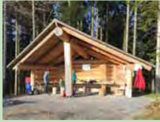
01 Änzenau am Etzel Koordinaten 700 022 / 225 720