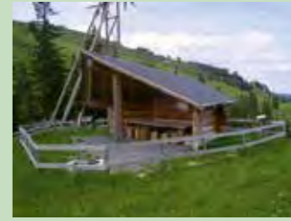
53 Laucheren, Hoch-Ybrig Koordinaten 701 568 / 207 106