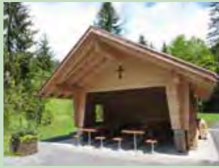
17 Sagenweid, Euthal Koordinaten 705 977 / 217 540