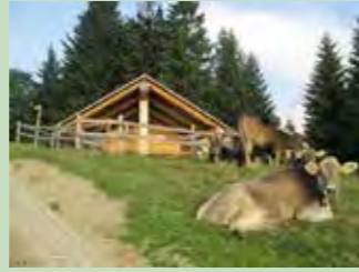
03 Wissegg bei Stöcklichrüz Koordinaten 704 336 / 223 898