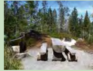
51 Bei der Fuederegg Hoch-Ybrig Koordinaten 702 010 / 207 794