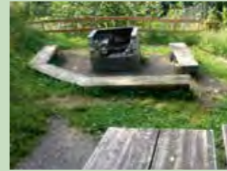
60 Kreuzegg, Rothenthurm Koordinaten 694 516 / 218 004