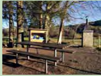
12 Südl. Kloster Au (Vita-Parcour) Koordinaten 697 655 / 218 579