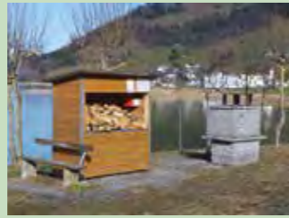
19 Surfplatz, Euthal Koordinaten 704 812 / 216 429