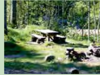
44 Fallenbach, Oberiberg Koordinaten 700 138 / 210 169