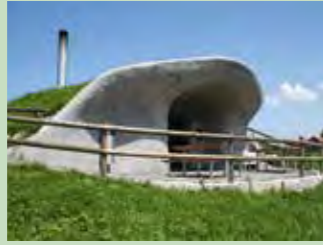
02 Altberg, Bennau Koordinaten 698 262 / 223 285