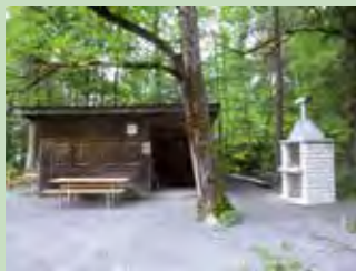
30 Chalhoboden, Studen Koordinaten 707 698 / 214 111