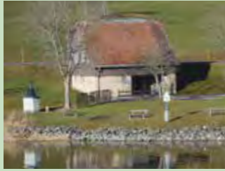
05 Langrüti, Egg Koordinaten 702 387 / 223 093