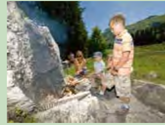
50 Seeblisee, Hoch-Ybrig Koordinaten 702 564 / 207 755