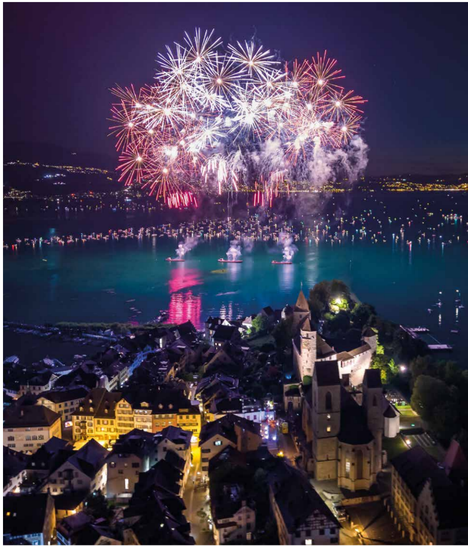
2022 auf einen Blick