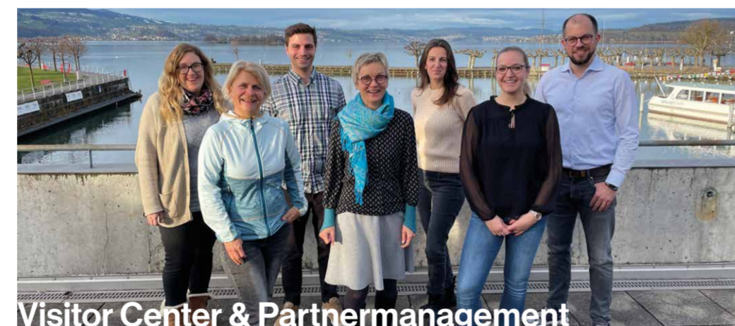
Visitor Center & Partnermanagement